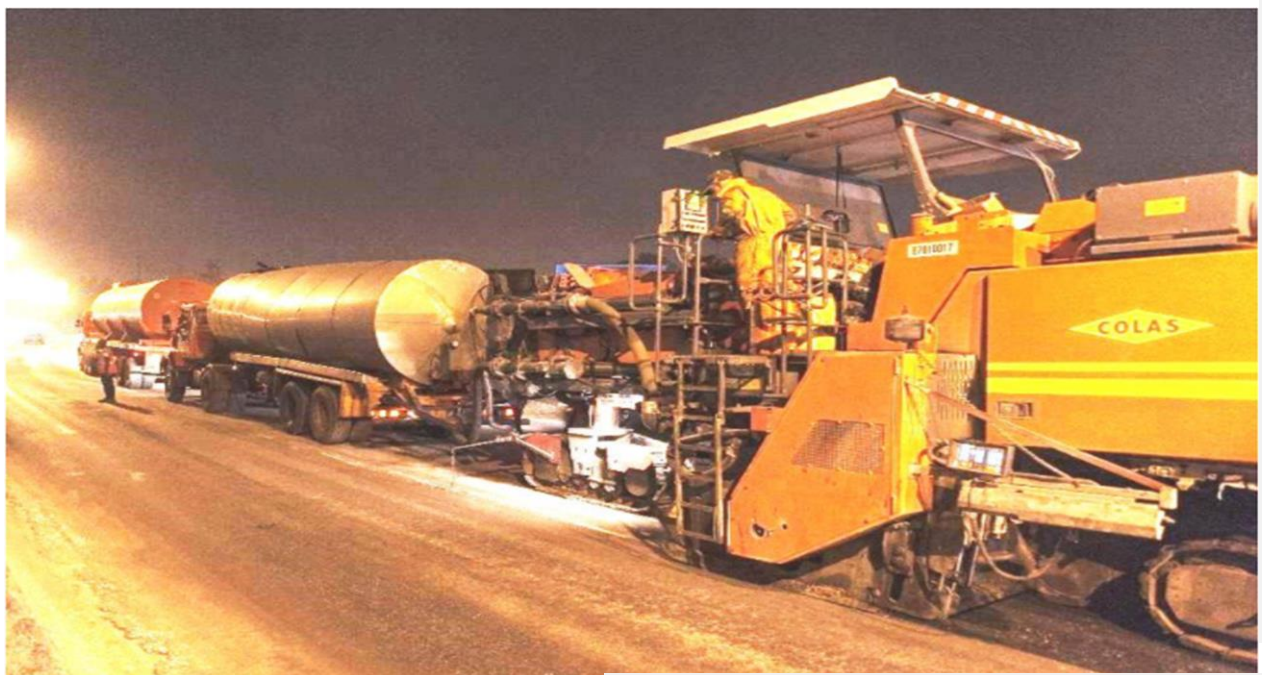
TRAVAUX DE RENFORCEMENT DE L'AXE BOUAKE- FERKESSEDOUGOU

Ce document présente l'évolution trimestrielle des réalisations physique et financière de 19 projets nationaux à caractère intégrateur